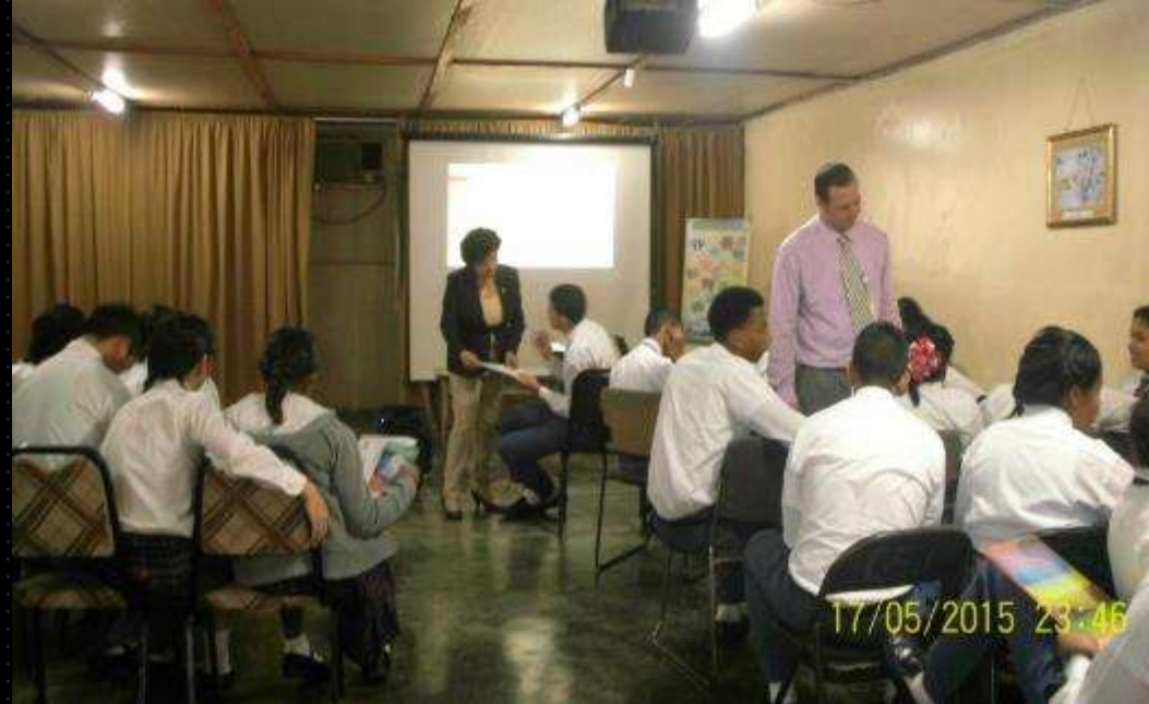
Gira al Colegio Parroquial San José de Almirante 17 de mayo de 2015