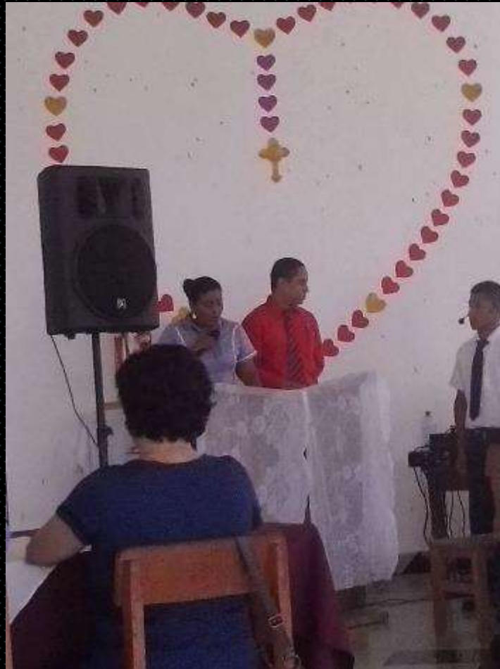
Jurado en el Concurso interno de Oratoria del Colegio San Agustín de Kankintú