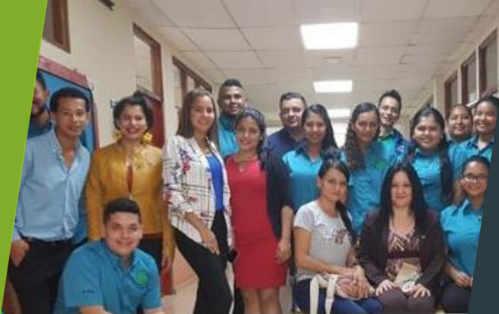
Seminario Taller Diseño y Animación para la Educación dirigido por estudiantes de Licenciatura en Informática Aplicada a la Educación. Facultad de Ingeniería de Sistemas Computacionales.