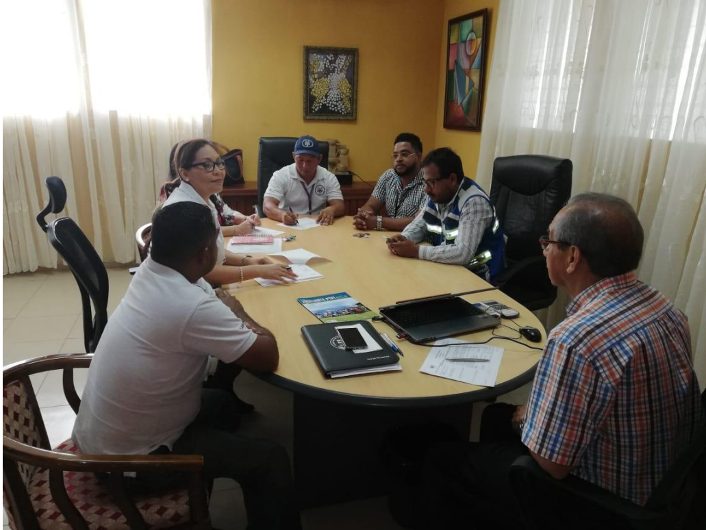
Auditoria Interna ( 25 y 26 de abril de 2019) Auditoria de seguimiento ( 21 y 22 de octubre 2019)