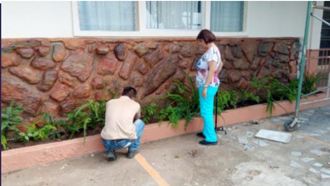
Contribución en el embellecimiento de las áreas verdes