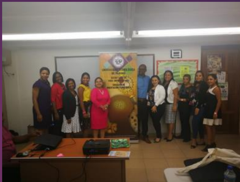
Encuentro de psicólogas en el Centro Regional de Colón