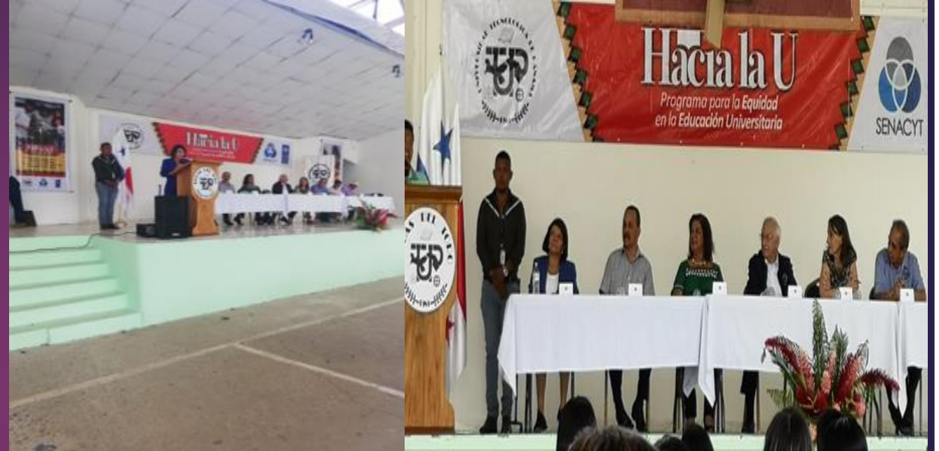
Lanzamiento oficial de Programa de Becas UTP-SENACYT "CAMINO A LA U", el 24 de abril en Chiriquí Grande