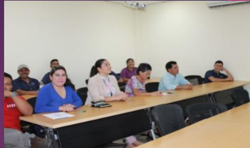
Charla: “ Ciberadición ” a personal administrativos y docentes tiempo completo

Video forum “Singularidad, Inteligencia Artificial y Robots” dirigida a personal administrativo, profesores tiempo completo y a estudiantes estudiantiles. Día 28 de febrero.