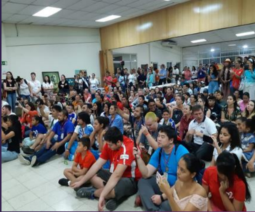
Bienvenida a 136 peregrinos y la familia de acogida de la JMJ