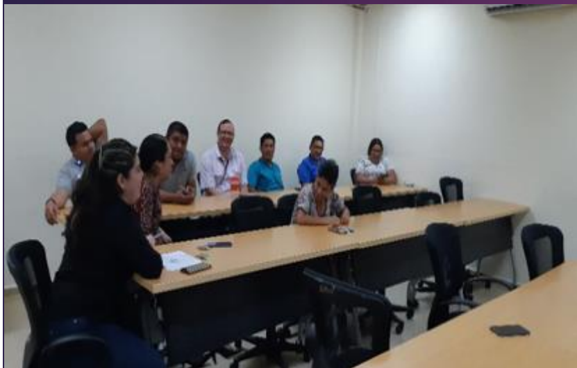
Conversatorio sobre la comunidad LGBT