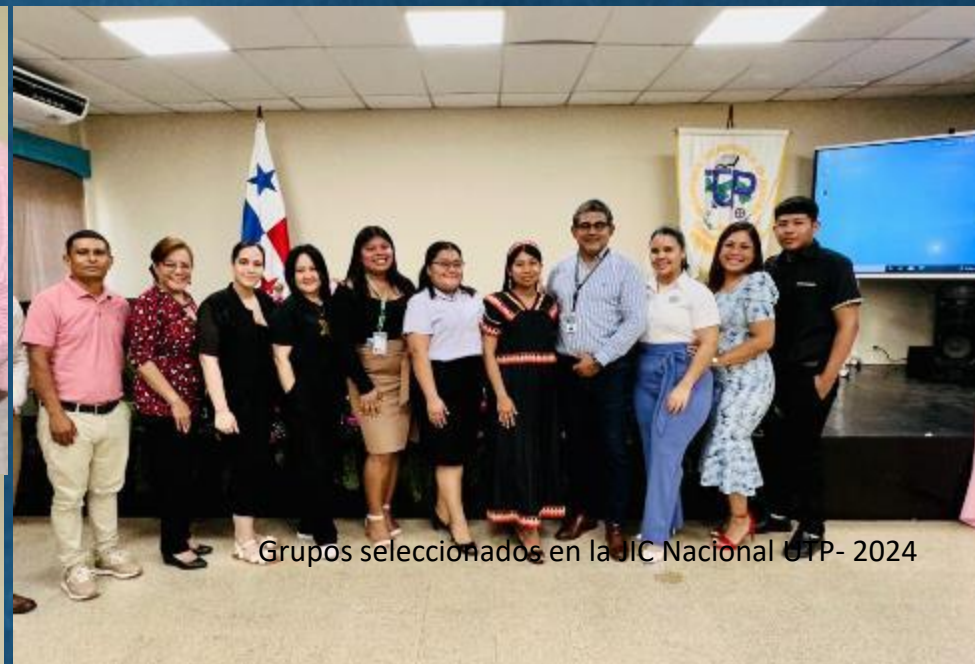
Grupos seleccionados en la JIC Nacional UTP- 2024