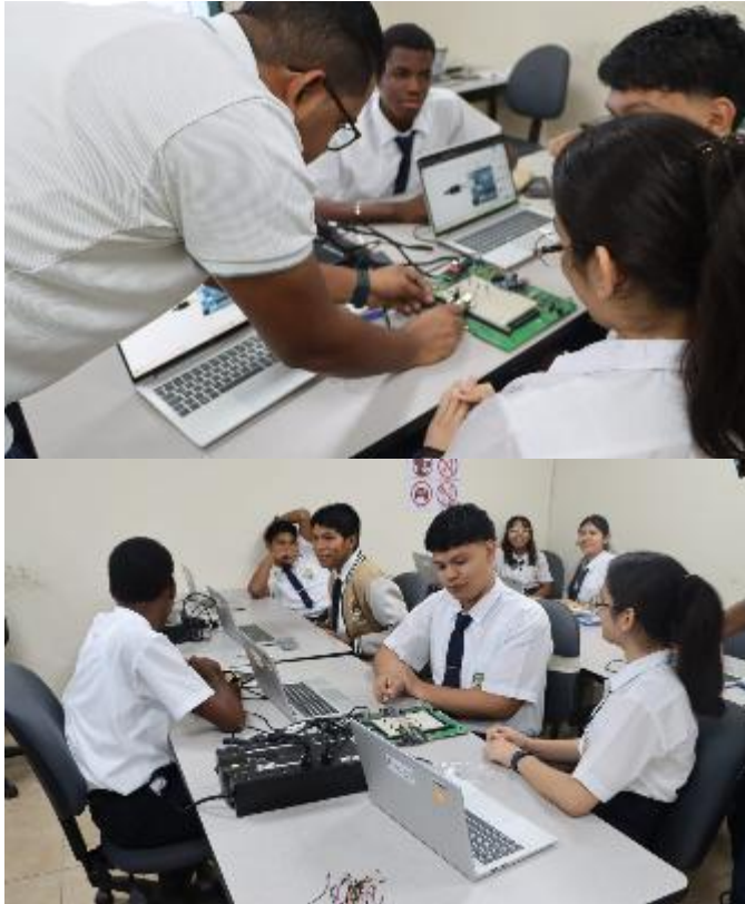
Figura 1. Inducción a sensores y actuadores para estudiantes del I.P.T Bocas Del toro