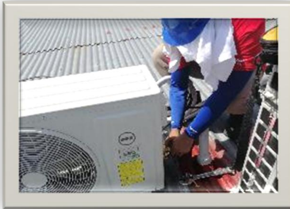
Figura 2. Instalación y mantenimiento de Aire acondicionado