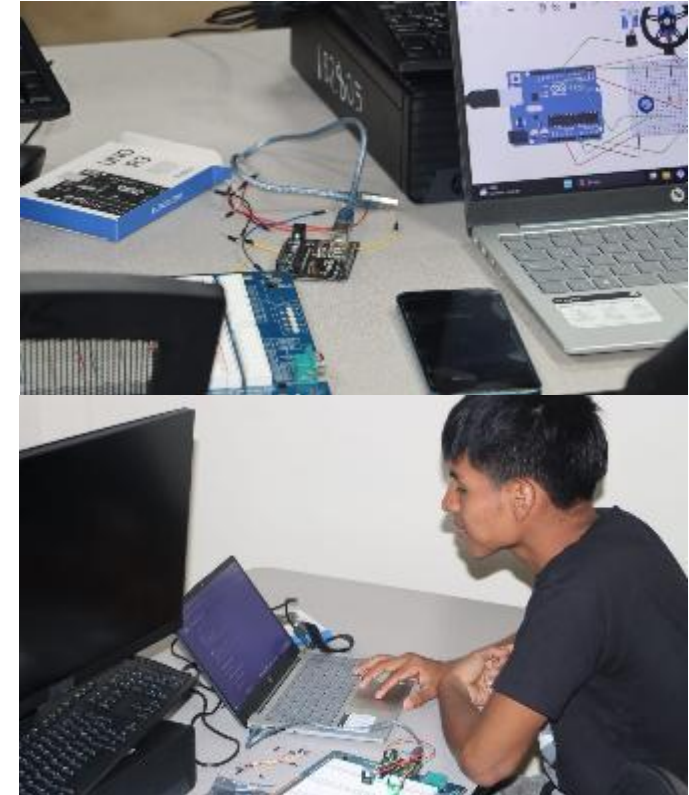
Figura 3. Curso de Programación para Arduino Uno R3