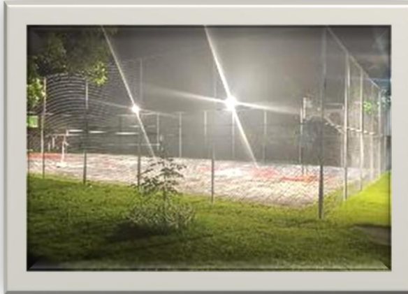
Figura 1. Instalación de lámparas para área recreativa