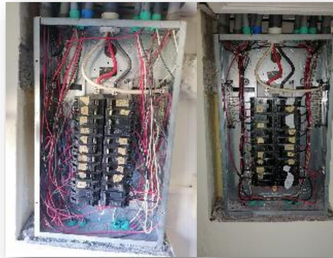
Figura 3. Corrección técnica de tableros de distribución