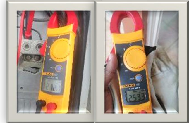
Figura 4. Rectificación de Bajo voltaje