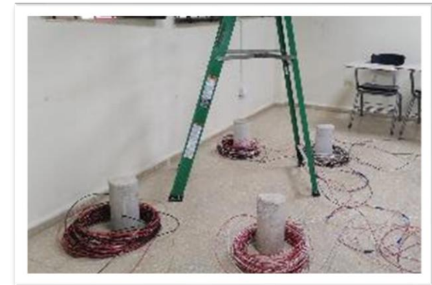
Figura 5. Instalación de salidas eléctricas para nevós anexos del Centro regional.