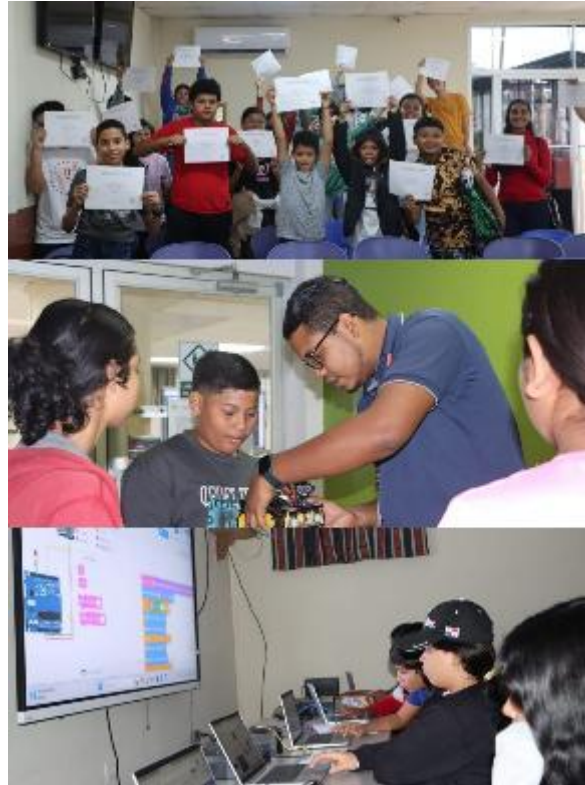
Figura 2. Tecno Camp 2025